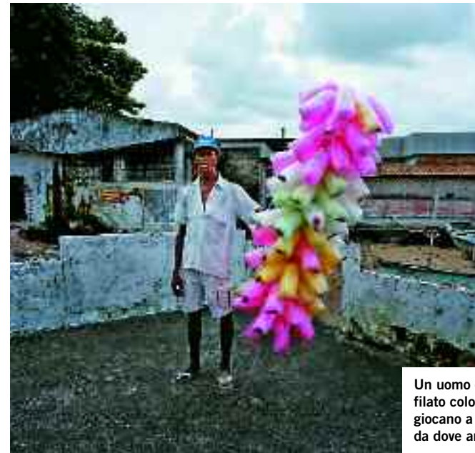
Un uomo che vende zucchero filato colorato. Sopra: dei ragazzi giocano a racchette sul mare da dove arrivavano gli schiavi