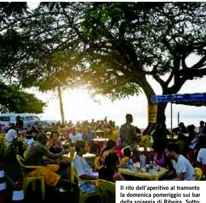
Il rito dell'aperitivo al tramonto la domenica pomeriggio sui bar della spiaggia di Ribeira. Sotto: la sede in ristrutturazione del municipio sulla piazza Lacerda

ne, e anima del Carnival Ouro Negro, che riunisce